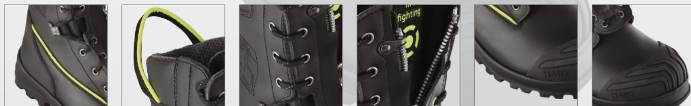
HEEL LOCK SYSTEM